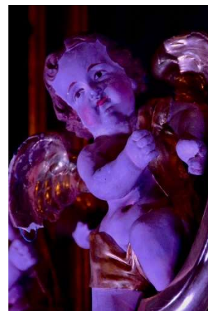
Église de Villaroger en Haute-Tarentaise (détail).