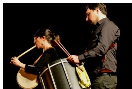
Bal Renaissance été 2023 avec Into the Winds. Feissons-sur-Isère.

Un bal traditionnel. Dans ce sens, un spectacle participatif permet chaque été de vivre la soirée de manière plus active. Forts du succès du bal Renaissance de l'été dernier, nous proposerons au public de danser avec le Kraken Consort au rythme des jigs et reels d'Écosse et d'Irlande le 7 août.